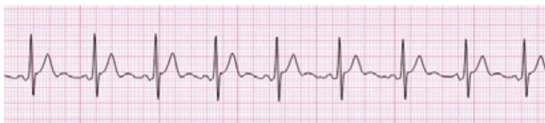
Elephantech 製 Ag / AgCl 電極 + 導電性ゲル