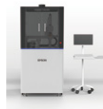
EPSON R&D用インクジェット装置